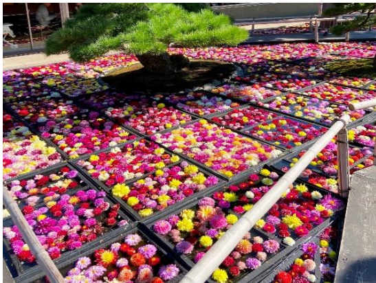
由志園…す・すごい! お花の量