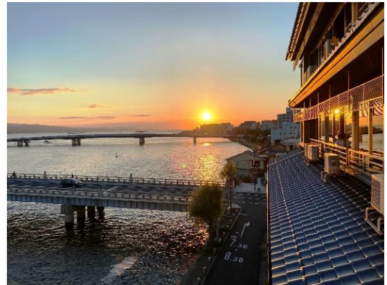
日本の夕日百選…宍道湖の夕日