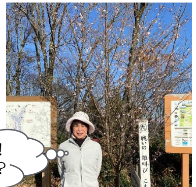
冬なのに桜見物！ 縁起いいかも〜？