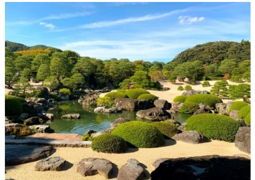
足立美術館…美しい庭園 ☆ 3